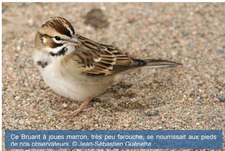
Ce Bruant à joues marron, très peu farouche, se nourrissait aux pieds de nos observateurs.

Le fait marquant de cette semaine, plutôt calme, est sans aucun doute la visite d'un Bruant à joues marron, mardi dernier. L'oiseau se nourrissait de graines et a tenu compagnie à nos observateurs durant toute la journée. Il n'a cependant pas été revu le lendemain. Cette espèce niche dans l'Ouest du continent. Au Canada, elle est habituellement observée de la Colombie-Britannique à la Saskatchewan. Il s'agissait de la seconde visite en trois ans d'un Bruant à joues marron sur le site de l'Observatoire. La première fois remontait au 19 octobre 2003.