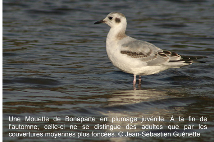
Une Mouette de Bonaparte en plumage juvénile. À la fin de l'automne, celle-ci ne se distingue des adultes que par les couvertures moyennes plus foncées.

assisté à l'arrivée de plusieurs espèces hivernantes cette semaine. En effet, nous avons reçu la visite de nos premiers Jaseurs boréaux, Durbecs des sapins, Sizerins flammés, etc. Dans le cas du Sizerin flammé, l'hiver 2005-2006, comme pour tous les hivers débutant par une année impaire, devrait se traduire par une irruption importante sous nos latitudes. Ces irruptions sont reliées à de faibles productions de cônes dans la forêt boréale.