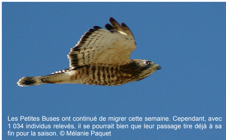
Les Petites Buses ont continué de migrer cette semaine. Cependant, avec 1 034 individus relevés, il se pourrait bien que leur passage tire déjà à sa fin pour la saison.

Vous rappelez-vous de la photo du pygargue bagué, parue dans la chronique de la semaine dernière ? Nous avons appris que cet oiseau a été bagué le 25 mai 2004, à Cobbosseecontee Lake, dans le Maine (430 kilomètres de Tadoussac). D'après Charlie Todd, biologiste au Maine Department of Inland Fisheries and Wildlife , il s'agirait du premier pygargue bagué au Maine à être rapporté au Québec depuis le début de leur programme (près de 800 individus bagués depuis 1975).