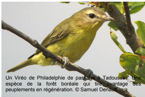
Un Viréo de Philadelphie de passage à Tadoussac. Une espèce de la forêt boréale qui tire avantage des peuplements en régénération.