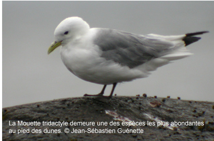
La Mouette tridactyle demeure une des espèces les plus abondantes au pied des dunes.

Toutefois, nous avons découvert que durant l'automne, l'abondance des Mouettes de Bonaparte fluctue selon un cycle d'environ 14 jours. L'état de la marée (basse ou hautes) n'est donc pas le seul facteur à considérer pour l'observation des oiseaux côtiers. À l'aide d'une table de marées, si vous prenez le temps de calculer l'écart entre la plus basse et la plus haute marée d'une journée, vous constaterez que la hauteur du marnage suit également un cycle d'environ 14 jours. Sans qu'on puisse encore l'expliquer, on a remarqué que le nombre de mouette est corrélé au marnage et culmine lors des plus grands écarts de marée, suivant un demi cycle lunaire. Vous trouverez une table des marées sur le site web du Service hydrographique du Canada ( www.niveauxdeau.gc.ca ).