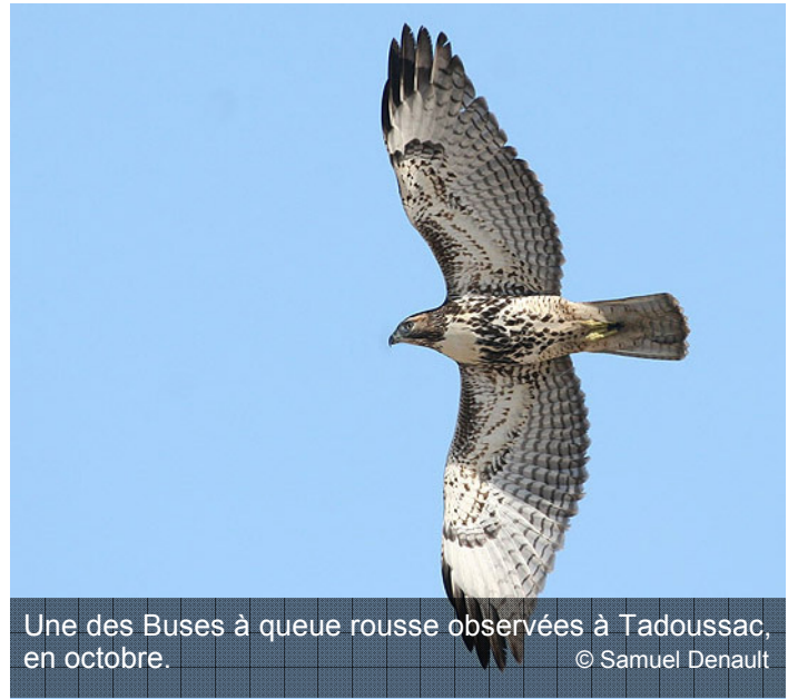
Une des Buses à queue rousse observées à Tadoussac, en octobre.

Les deux dernières semaines ont été particulièrement riches du côté des rapaces. En effet, 5 425 oiseaux de proie ont été aperçus aux dunes en 92 heures d'observation par site, portant ainsi le total de la saison à 16 346 individus. Si octobre est le mois des oiseaux pour BirdLife International, à l'OOT, il s'agit plus particulièrement du mois des Buses à queue